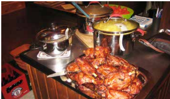
Bei diesem Anblick läuft jedem das Wasser im Mund zusammen.

Aber wie das so ist, alles hat einmal ein Ende. Mit dem Gefühl einen wunderbaren Abend in geselliger Runde verlebt zu haben schloss gegen 22 Uhr die Veranstaltung.