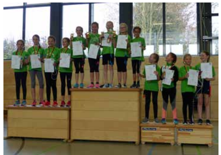
Die Sieger der AK4 im Fortgeschrittenen-Wettkampf

Alles in allem ein sehr erfolgreicher Wettkampf mit vielen Medaillen und Pokalen!