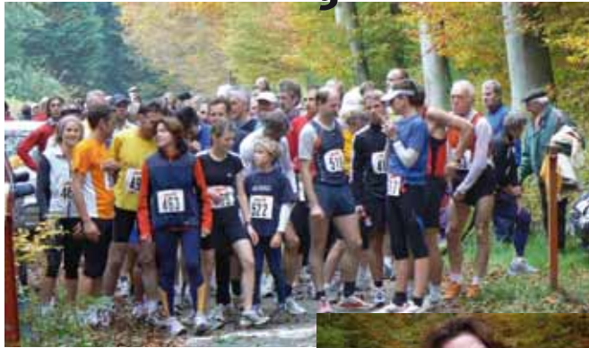
Start in herbstlicher Kulisse.

Begonnen hatte der Nauberglauf mit 22 hoch motivierten Kindern, die die 600-m-Strecke absolvierten und anschließend stolz Urkunden und Medaillen in Empfang nahmen.