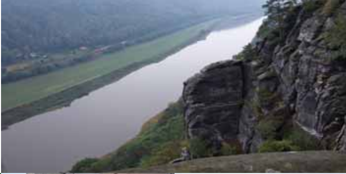
Im Bild ganz rechts unten die Edmundsklamm. Der Weg führte durch enge und wilde Felsformationen. Im mittleren Teil mussten wir mangels Weg auf das Wasser der hier gestauten Klamm ausweichen. Dafür standen Kähne zur Verfügung mit denen man für ein kleines Entgelt von freundlichen Skippern wieder zum Ausgangspunkt zurückgestakt wurden.