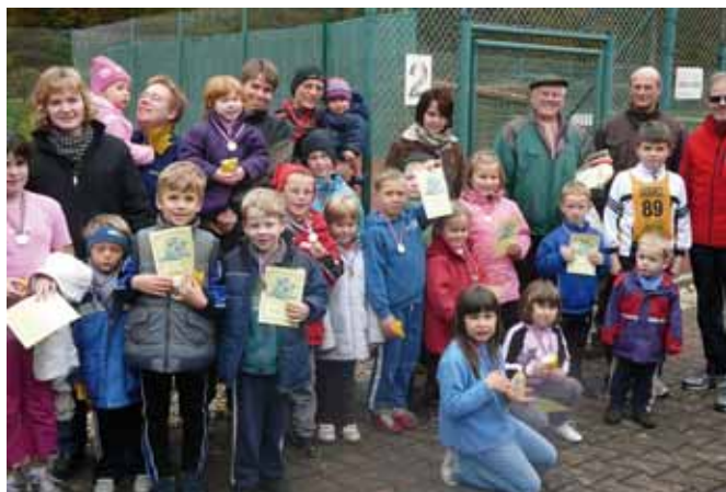
Der stolze Läufer Nachwuchs des Turn- und Sportverein Nister.