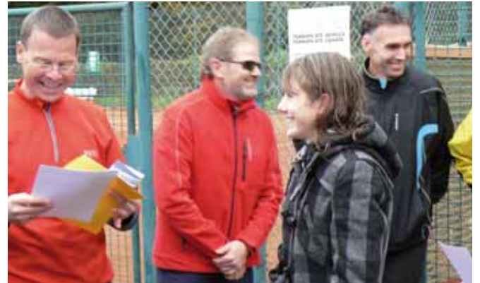
Eine frisch geduschte Siegerin.