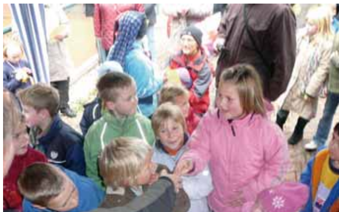
Strahlende Gesichter bei der Medallenausgabe.

Unter diesem Motto starteten auch in diesem Jahr wieder viele Kinder und nahmen die 600- bzw. 1200- m-Strecken unter ihre Füßchen. Nach der Anmeldung und der Vergabe der Startnummern konnten es die kleinen Läufer kaum erwarten, bis es los ging. Direkt nach dem Startzeichen legten die Kinder ein hohes Tempo vor, dass selbst die „großen Begleiter“ kaum Schritt halten konnten.