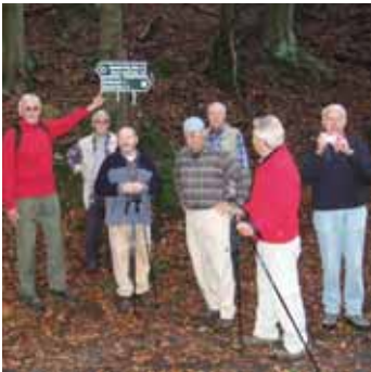
Wie in jedem Jahr stand die traditionelle Wanderung an. Eine Woche nach Lichtenhain, ein kleiner Ort zwischen Bad Schandau und Sebnitz, nahe der tschechischen Grenze.