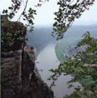
Ein Kulturtag in Dresden und vier Tage Wandern bei tollem sonnigem Herbstwetter standen auf dem Programm. Die Bilder auf dieser Seite sprechen für sich und können nur wenige Eindrücke und Erlebnisse wiedergeben wie z. B. die Felsenhöhle Kuhstall (oben und rechts), die berühmte Bastei mit Blick auf die Elbe bei Rathen (links und unten Mitte).