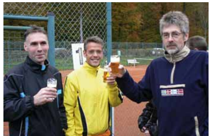
Prost – Nach einem gelungenen Lauf.